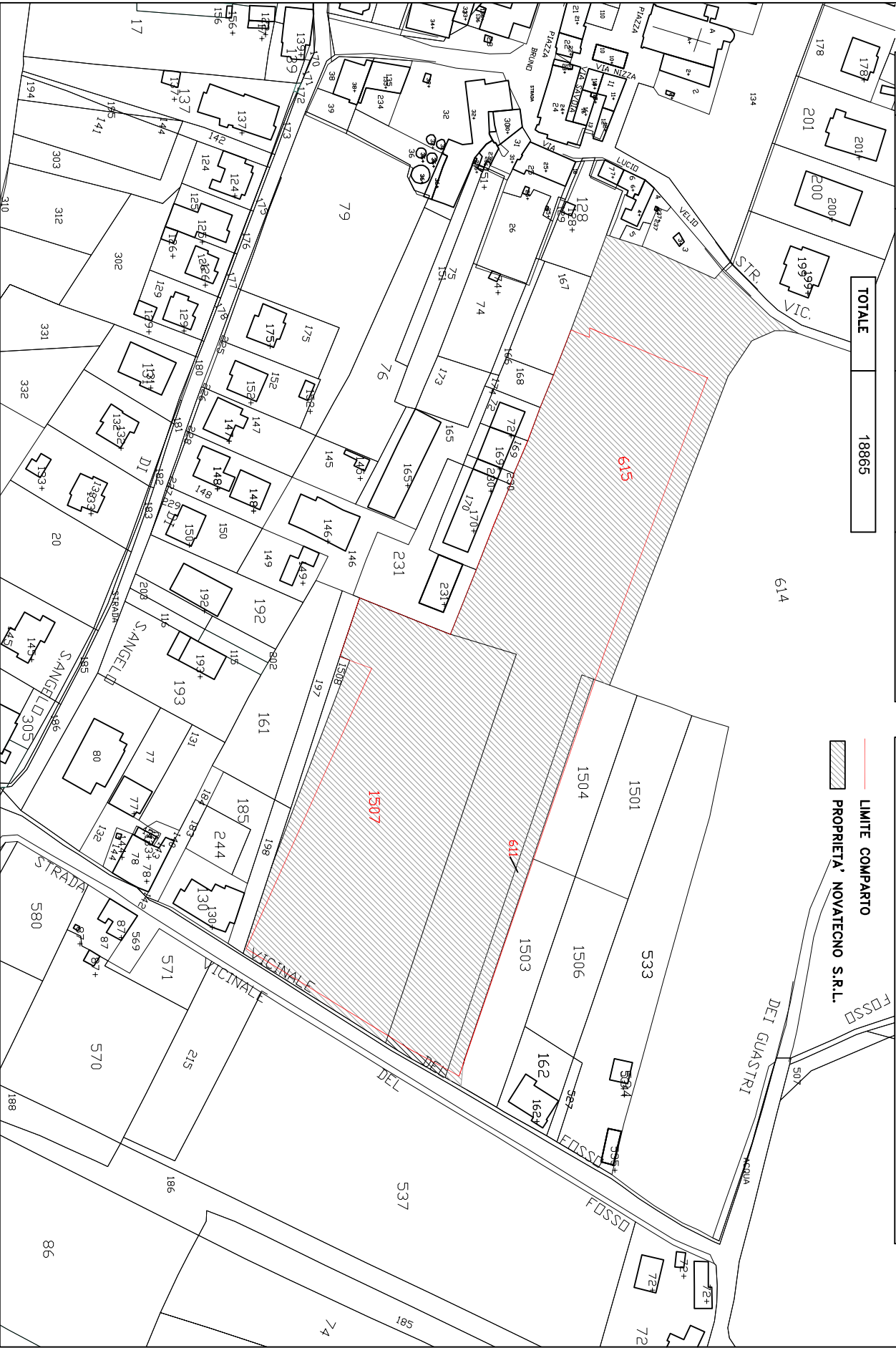
PLANIMETRIA scala 1:2000

— LIMITE COMPARTO ▨ PROPRIETA' NOVATECNO S.R.L.