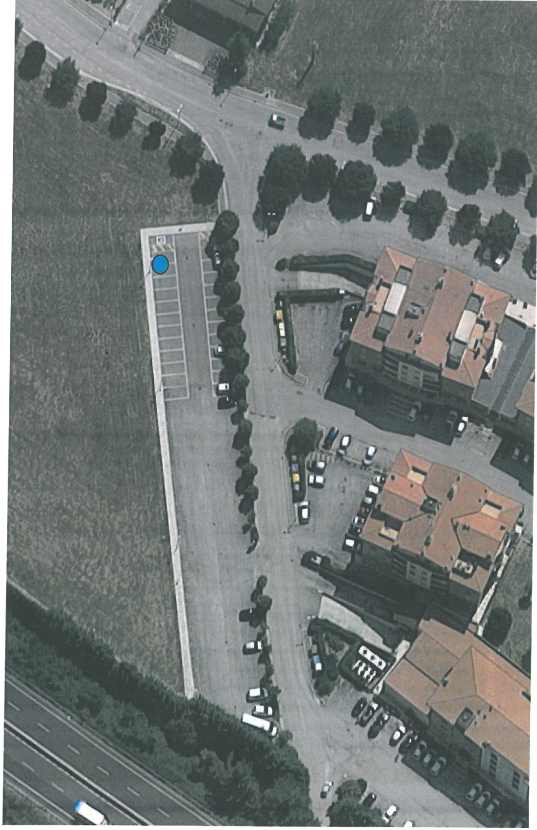
● Ubicazione nuova Casa dell'Acqua