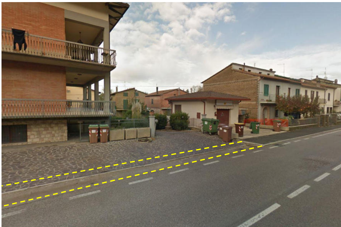
Vista del tratto finale dell'intervento in Via Franciscana