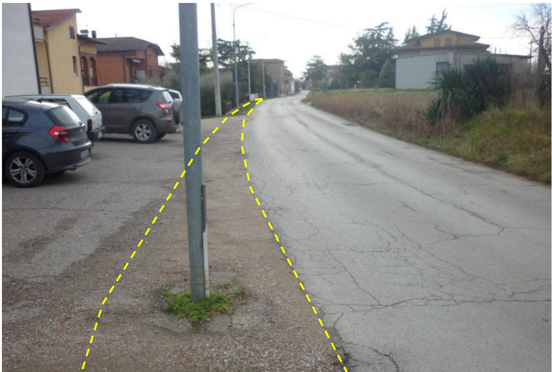
Vista lungo Str. Marscianese del Piano direzione Deruta