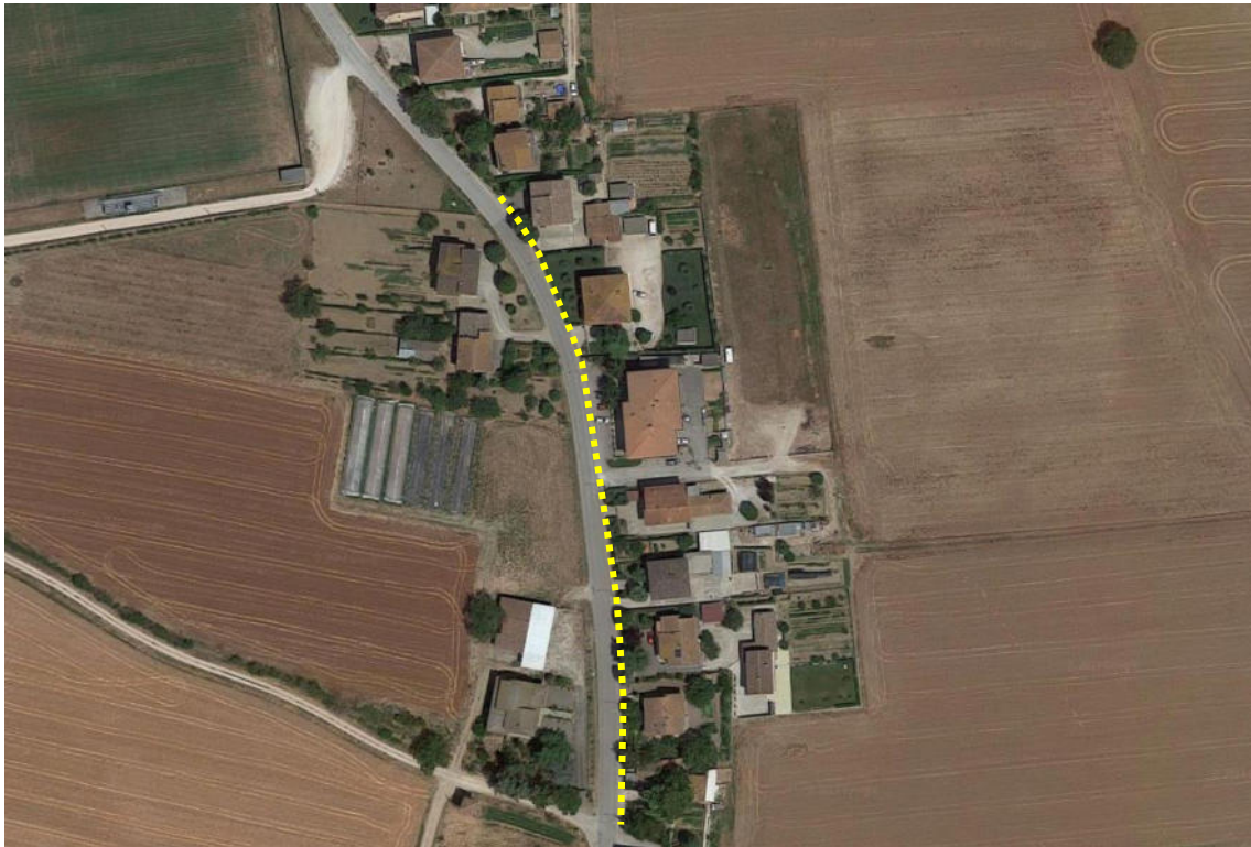
Planimetria di inquadramento dell'intervento del tratto di Str. Marscianese del Piano