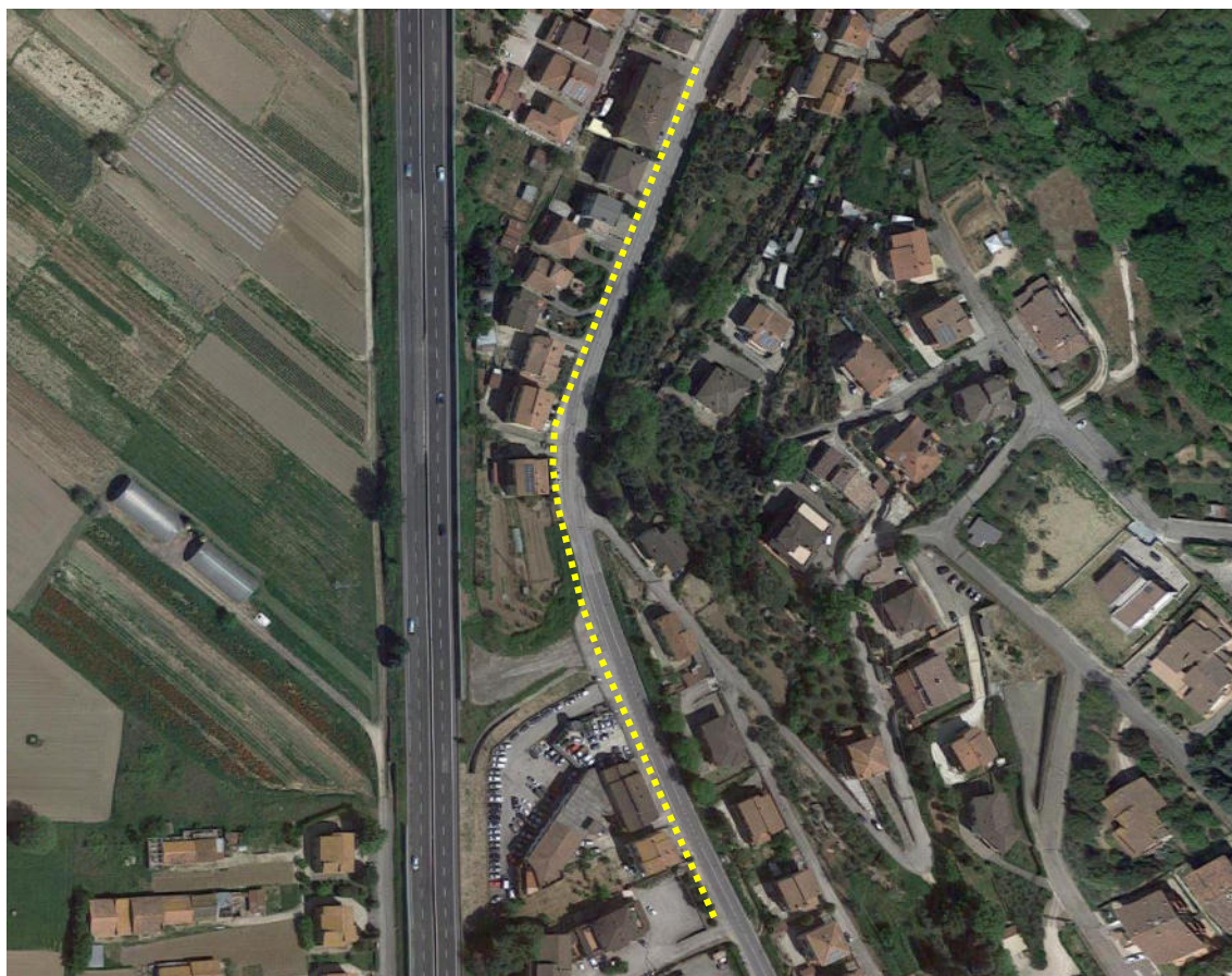
Planimetria di inquadramento dell'intervento del tratto di Via Francescana