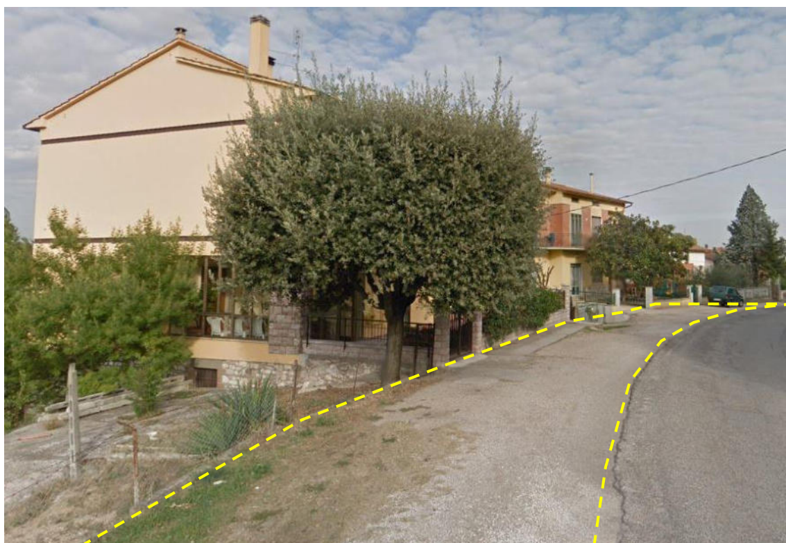
Vista di una porzione del tratto di Via Francescana