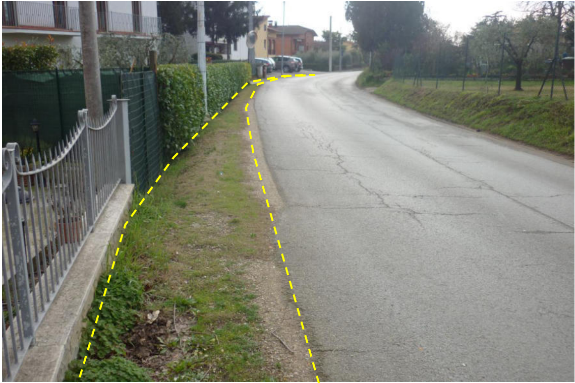
Vista lungo Str. Marscianese del Piano direzione Deruta