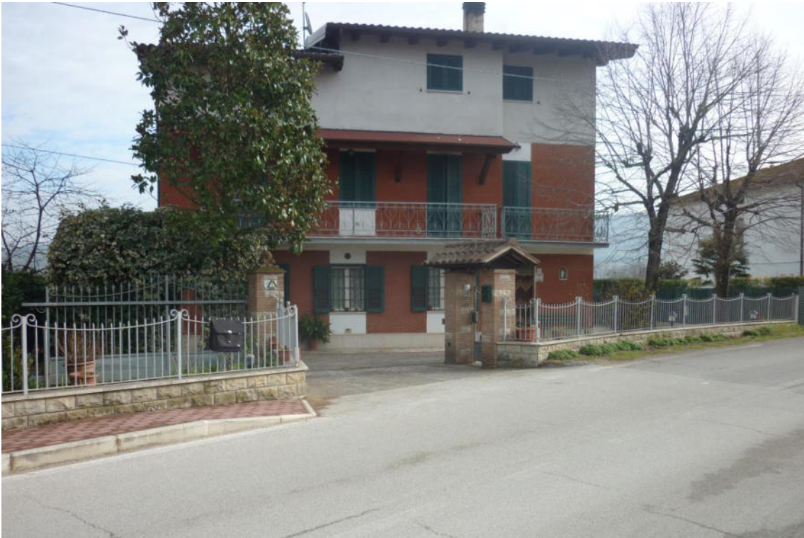
Vista del tratto iniziale dell'intervento lungo str. Marscianese del Piano