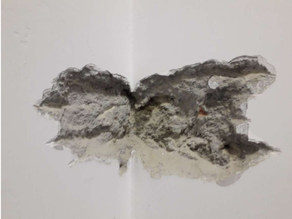
Saggio Visivo – SV3