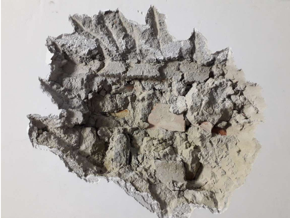
Saggio Visivo – SV5