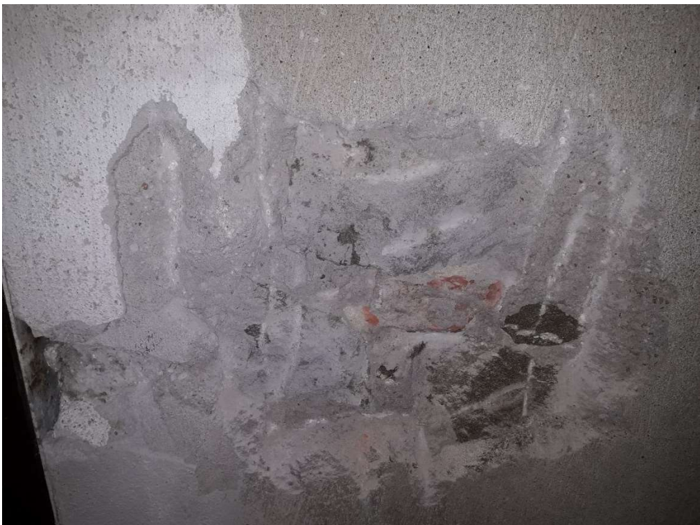
Saggio Visivo – SV4