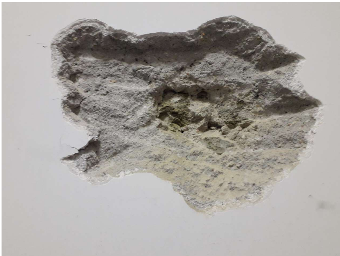
Saggio Visivo – SV8