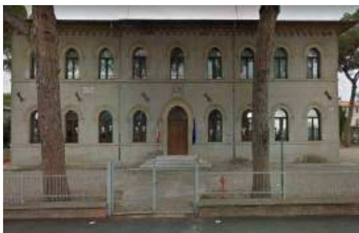
SCUOLA PRIMARIA DI SANT'ANGELO DI CELLE - VIA DANTE ALIGHIERI DERUTA (PG)