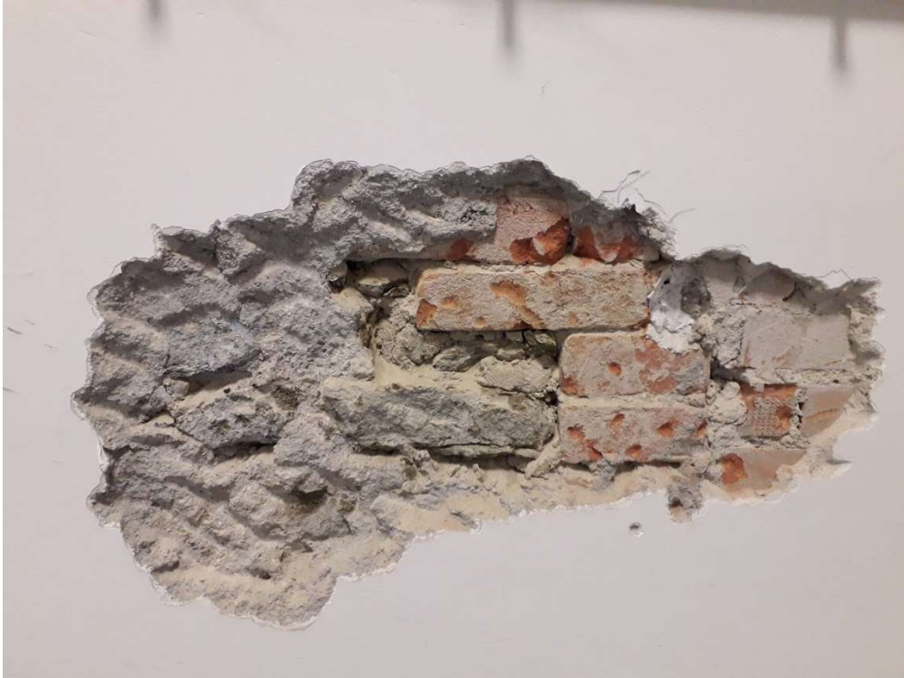
Saggio Visivo - SV1