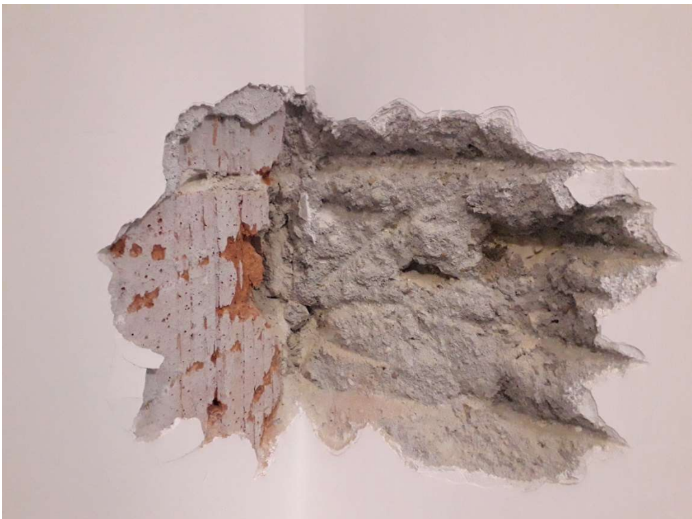
Saggio Visivo - SV2