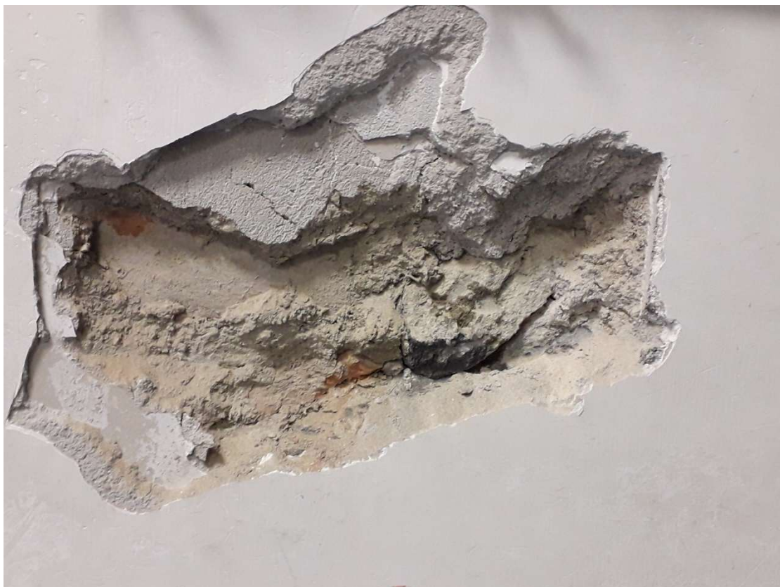
Saggio Visivo – SV7