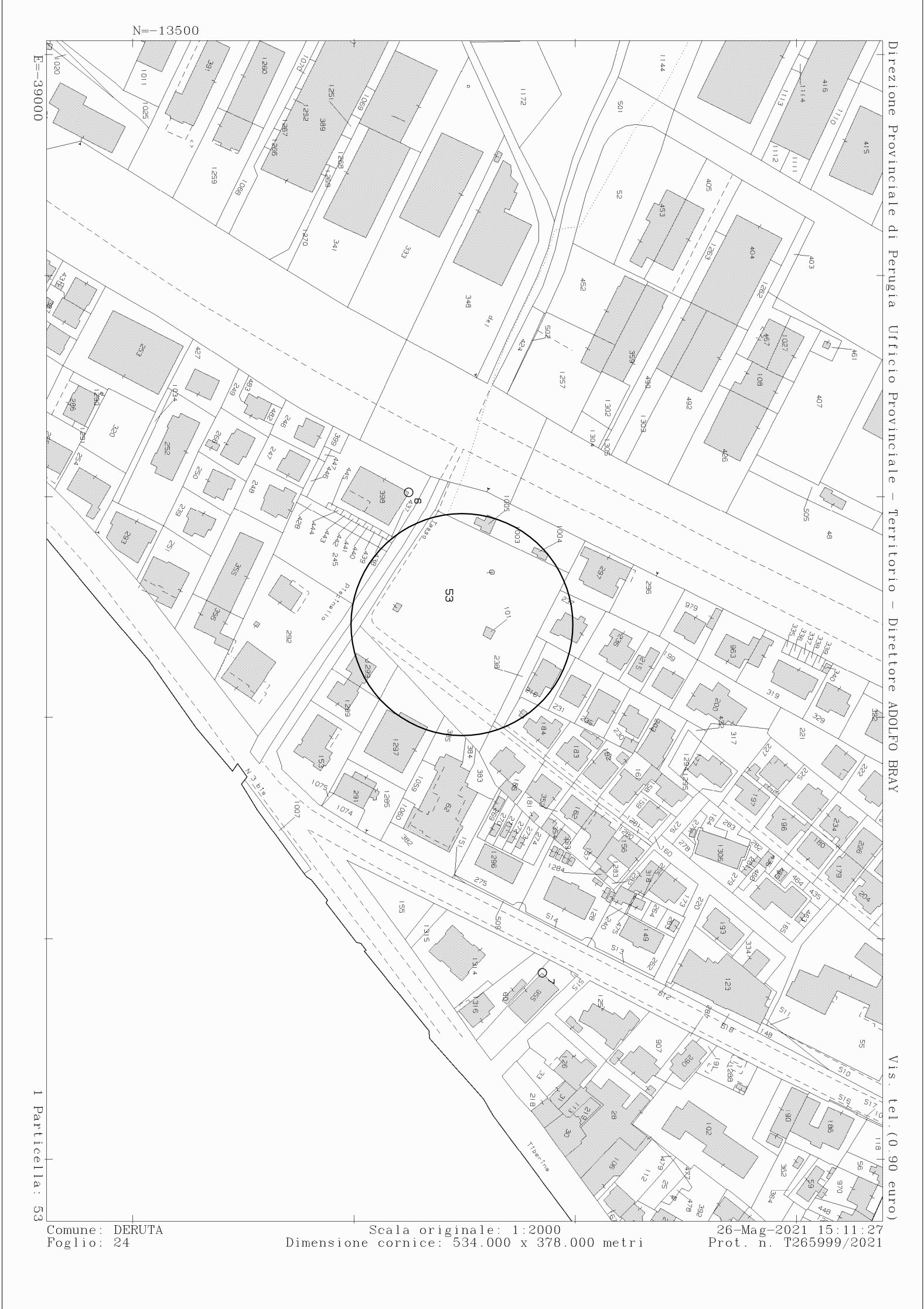
planimetria catastale 1:2000 fg. 24 part. 53-101