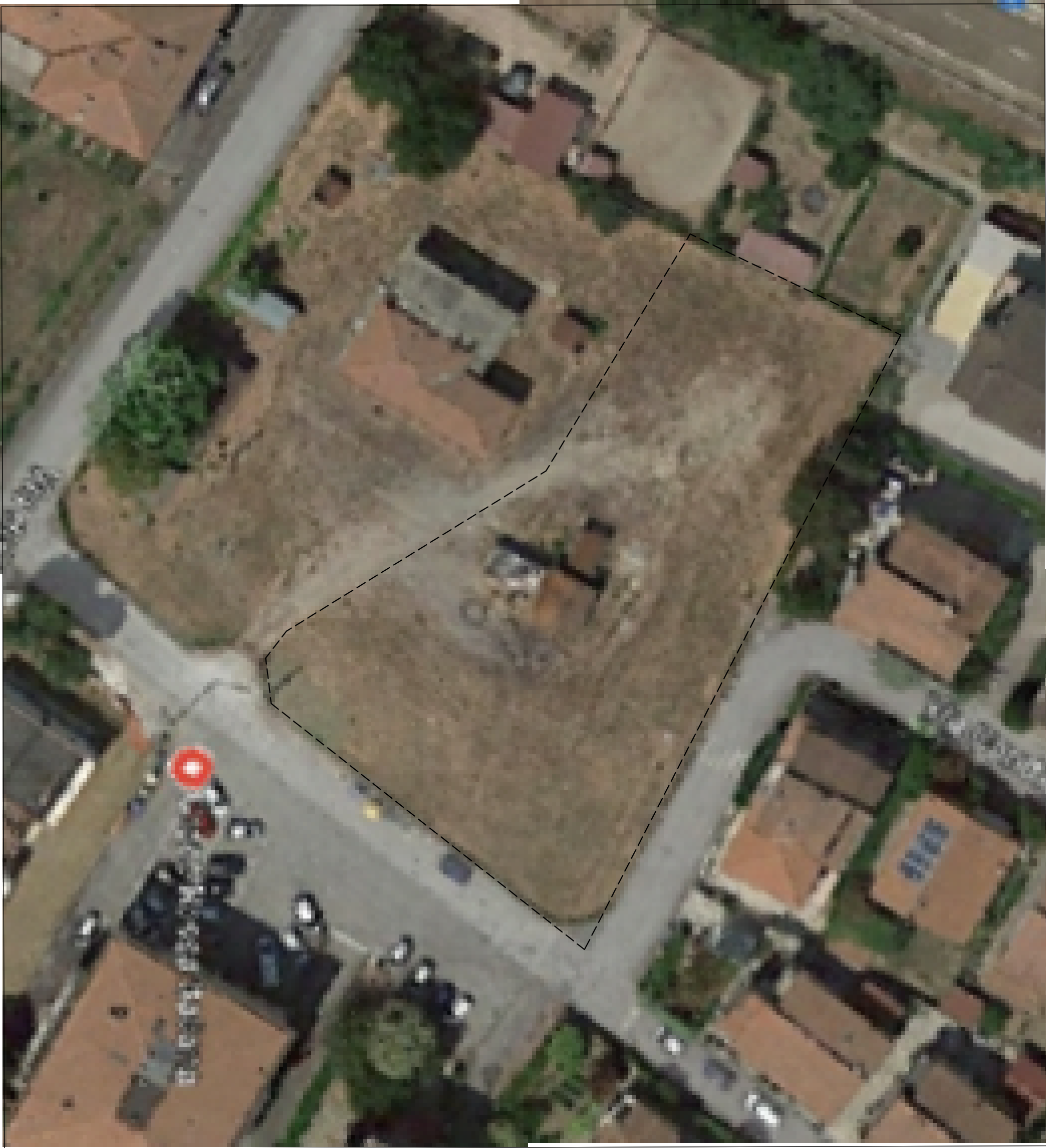
vista aerea zona di intervento