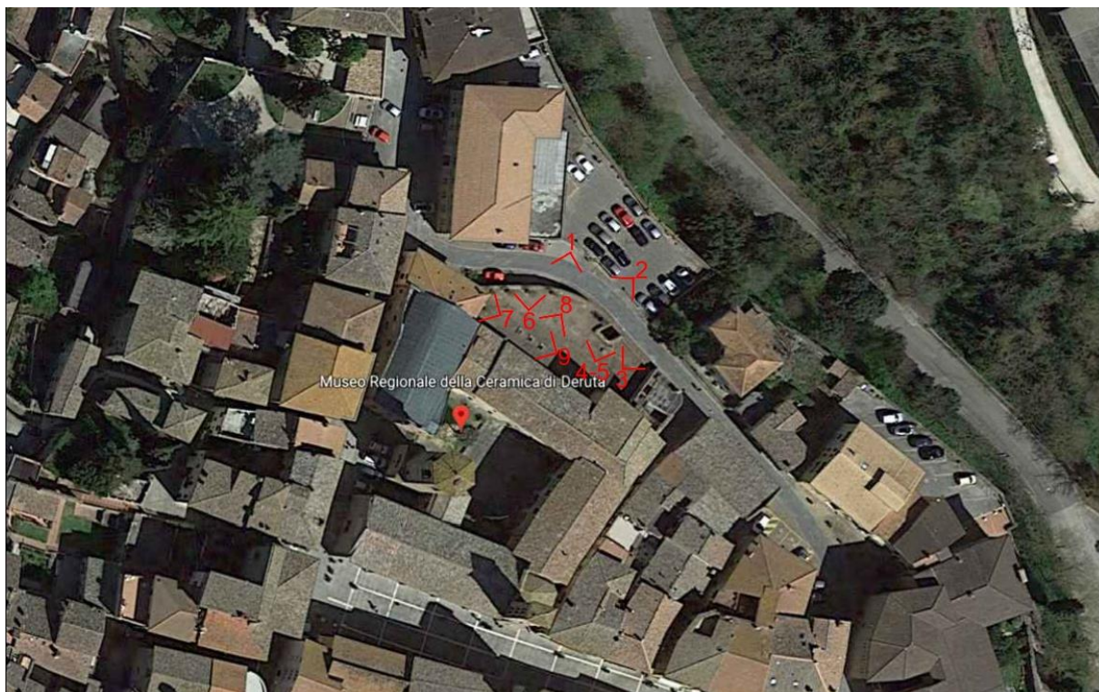
OROTOFOTO CON CONI OTTICI