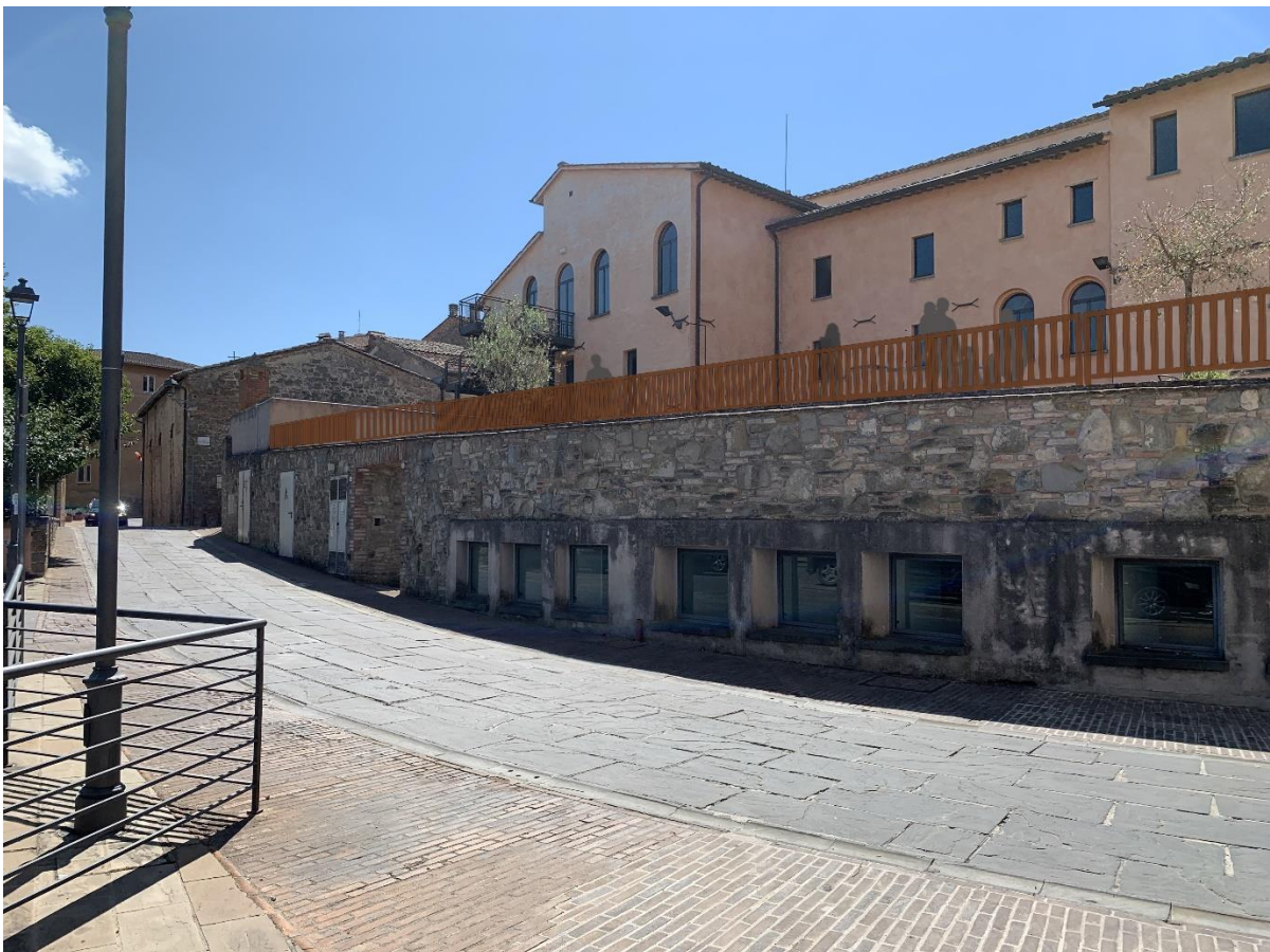
Rendering di progetto da Via Vittorio Emanuele