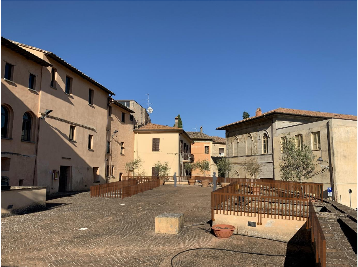
Rendering dal Museo Regionale della Ceramica