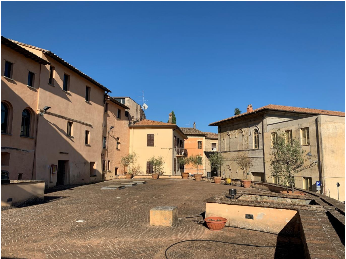
Vista attuale dal Museo Regionale della Ceramica