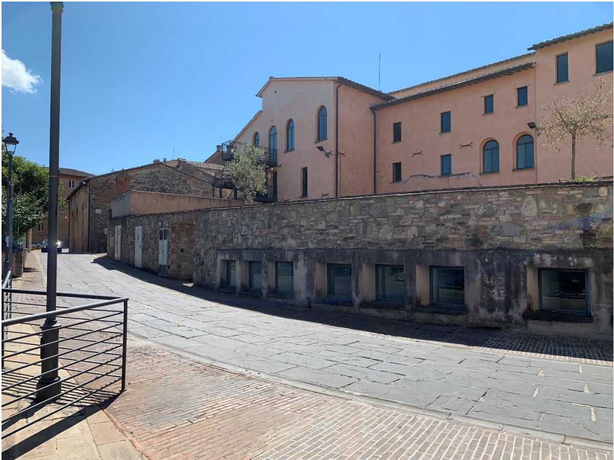
Vista attuale da Via Vittorio Emanuele