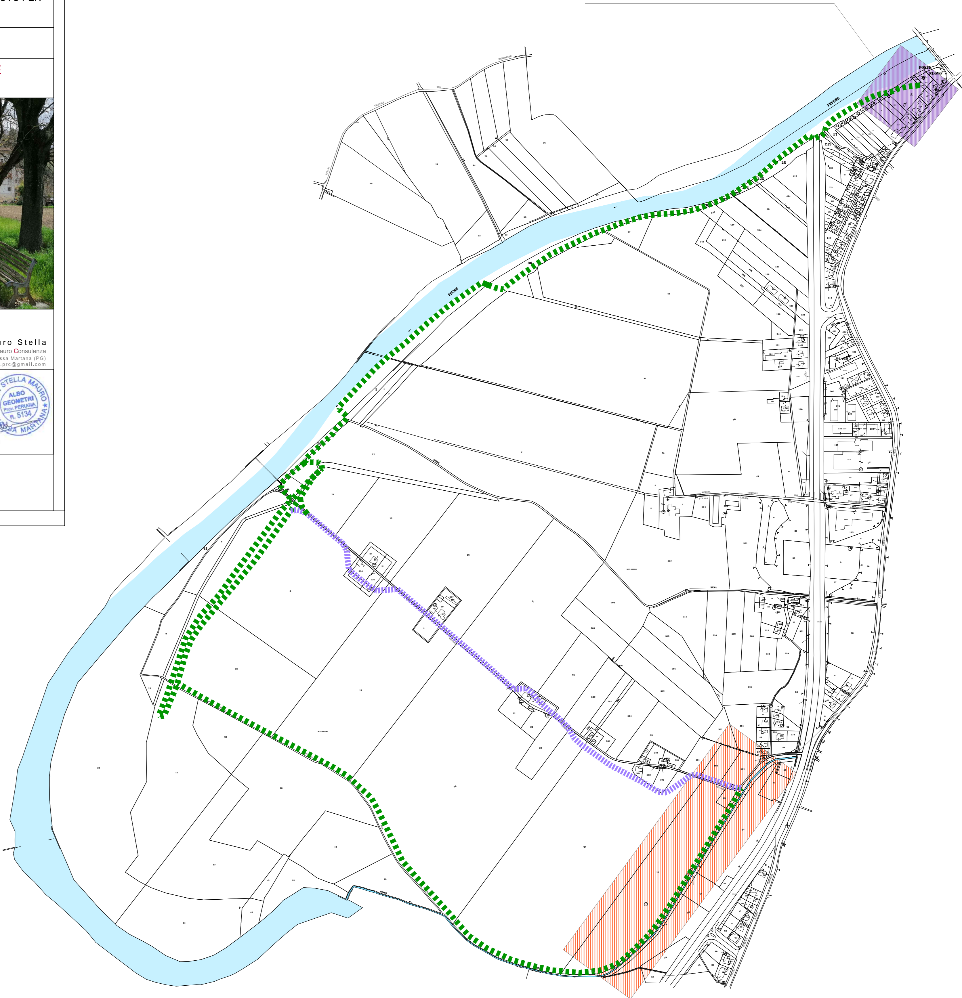
AREA DI INTERVENTO 2 - TAV. E-P05