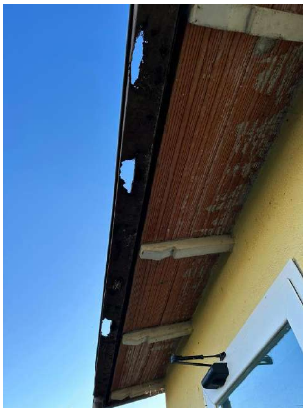
Grondaia fabbricato spogliatoi