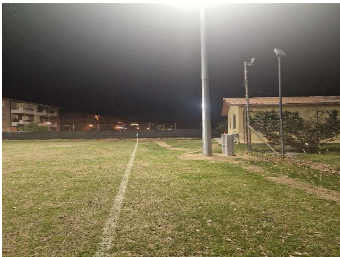
Pali illuminazione e colonnine alimentazione prive di protezione