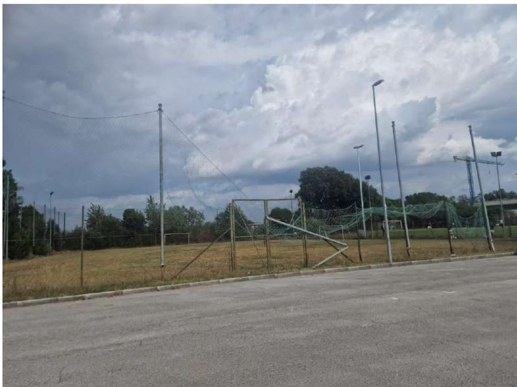
Rete campo allenamento