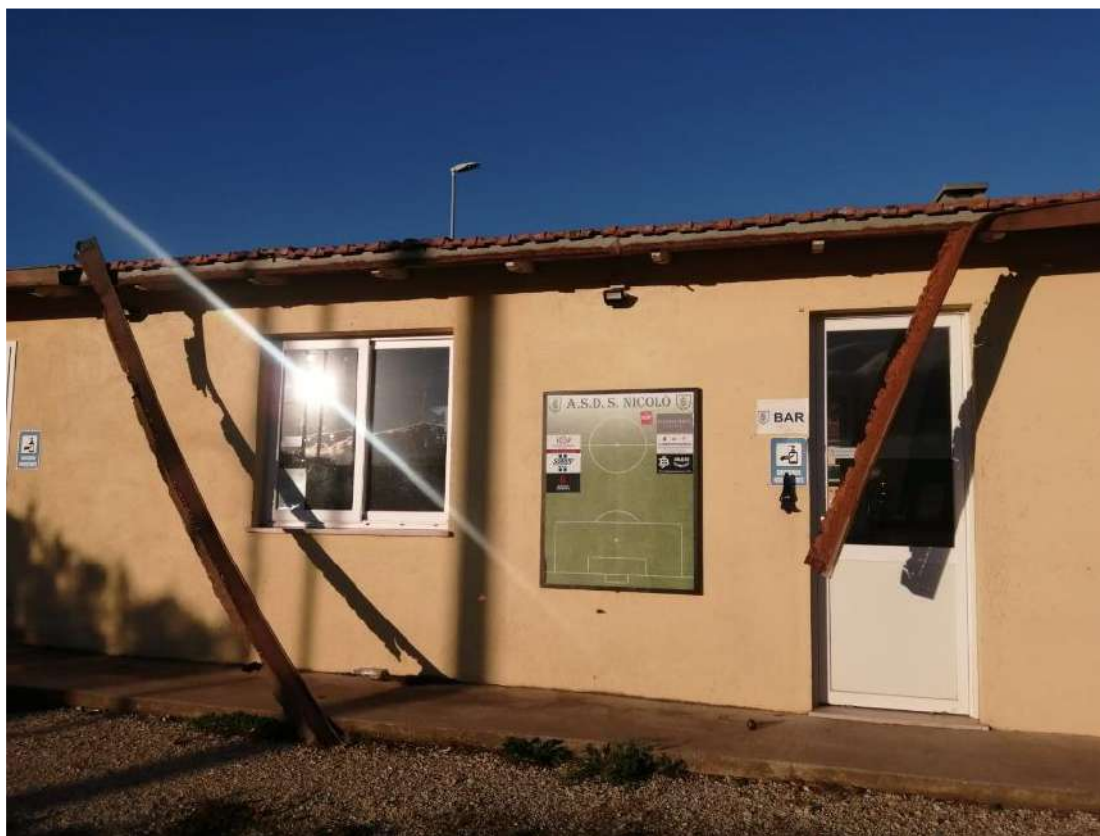
Grondaia fabbricato biglietteria/magazzino