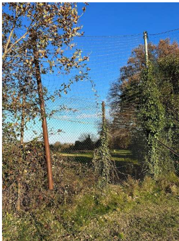
Rete dietro la porta campo principale