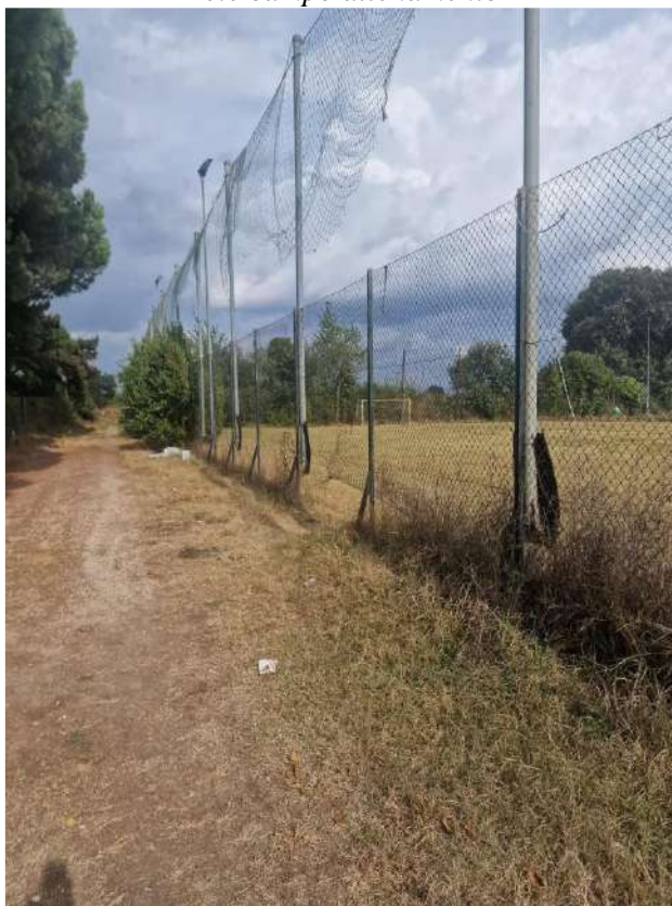
Rete campo allenamento