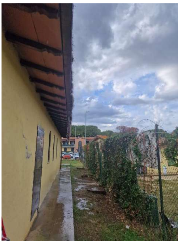
Grondaia fabbricato spogliatoi