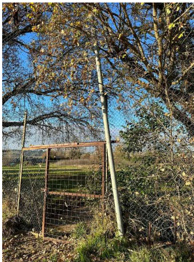
Rete dietro la porta campo principale