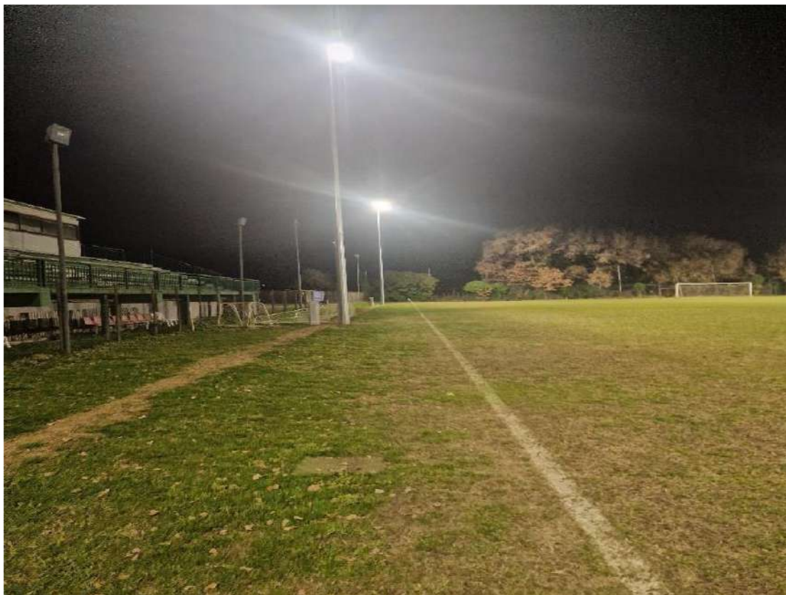
Pali illuminazione e colonnine alimentazione prive di protezione