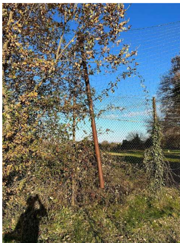
Rete dietro la porta campo principale