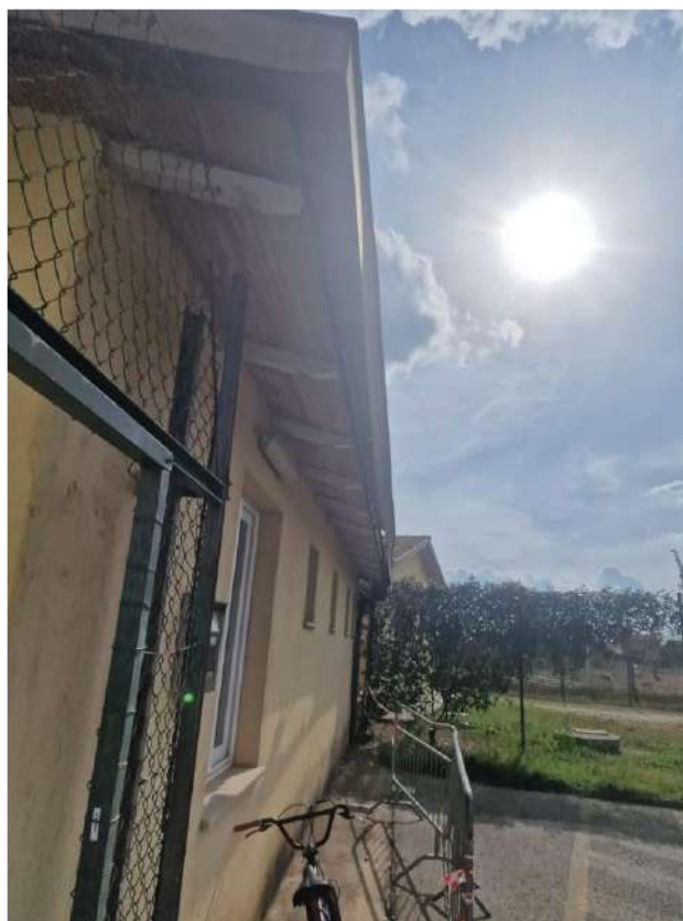
Grondaia fabbricato spogliatoi